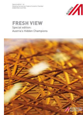
FRESH VIEW | Ediție specială Campionii din umbră ai Austriei (Download: Part 1 | Part 2 )

Pentru lista completă a broșurilor FRESH VIEW editions click aici .