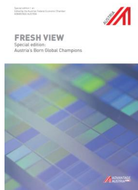
FRESH VIEW | Ediție specială Campionii cu start global ai Austriei (Download: Part 1 | Part 2 )

FRESH VIEW Magazine - structurat pe domenii, vă oferă informații demne de luat în seamă, pe care le puteți descărca direct pe computerul dumneavoastră. Ultra actual stau la dispoziție două noi ediții FRESH VIEW, pe care nu ar trebui să le ratați: