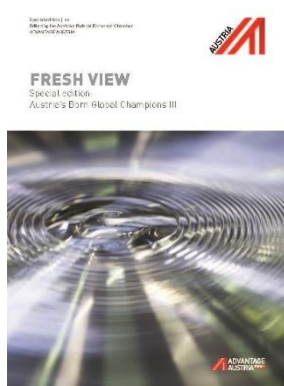
FRESH VIEW | Born Global Champions (Download: aici )

FRESH VIEW Magazine - structurat pe domenii vă oferă informații demne de luat în seamă, pe care le puteți descărca direct pe computerul Dumneavoastră. Astăzi vă prezentăm două broșuri FRESH VIEW, pe care probabil că nu le știți încă: