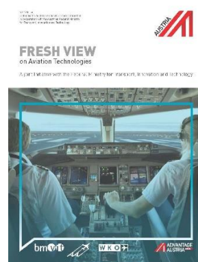
FRESH VIEW | Tehnologia aviatiei (Download: aici )

Pentru lista completă a broșurilor FRESH VIEW editions click aici .