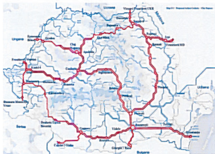
Rețeaua TEN-T Centrală & Globală